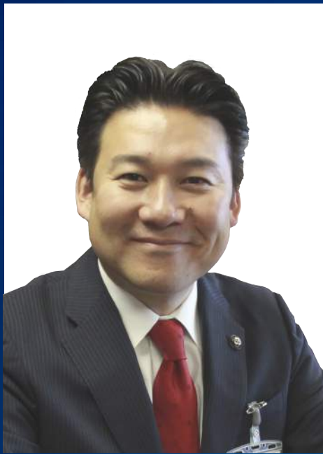
大分県別府市長 弁士 長野恭紘氏 (40)